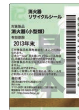
既製品用シール(見本)