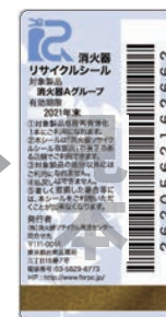
新品用シール(見本)

製品にはリサイクルシールが貼られています。耐用年数を過ぎたら、取扱い窓口へ引き渡してください。