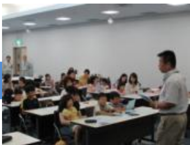
下水道の仕組みを解説