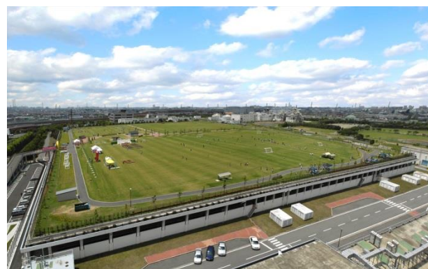
写真：中川水循環センターの上部公園 ※荒川水循環センター、新河岸川水循環センター、元荒川水循環センターにも上部公園があります。