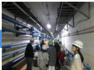
処理場の地下通路を見学