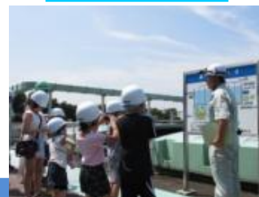
水処理の行程を見学

概要説明（約 30 分）→処理場内見学（約 40～50 分） ※ご希望によってスケジュール変更は可能です。 ※また、会議室等を使用して昼食をとることもできます。