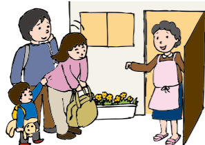
親戚・知人宅 ホテル避難