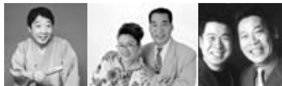
笑福亭鶴光 宮川大助・花子 コント山口君と竹田君

出演 笑福亭鶴光(落語)、宮川大助・花子(漫才)、コント山口君と竹田君(コント)、鏡味仙太・仙次(江戸太神楽)、牧野尚之(漫談・司会)