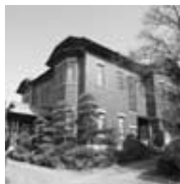
旧石川組製糸西洋館

集要項 (生涯学習課、各公民館、図書館に用意) にある申込書に記入し原稿と一緒に、直接または郵送により市教育委員会生涯学習課 (〒358・8511 入間市役所)