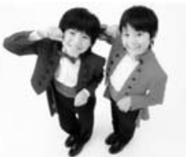
ゲストは「てじな~にゃ」でおなじみの、山上兄弟