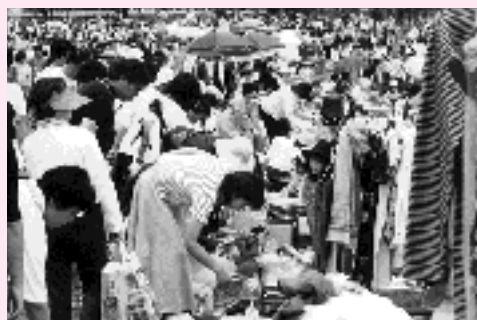
昨年のリサイクルフェア(フリーマーケット)