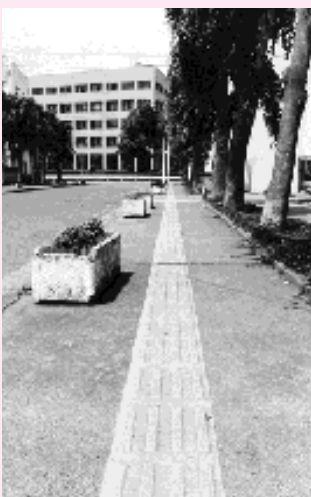
視覚障害者誘導標示