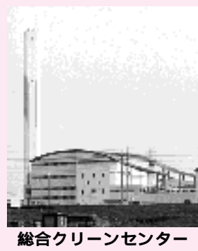
総合クリーンセンター