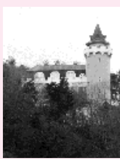
国民宿舎入間グリーンロッジ