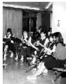
昨年の講習会の模様

主催 市民吹奏楽団、中央公民館 申し込み 6月20日(土)から30日 (火)までに中央公民館(☎964 2413)