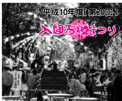
平成10年度(第20回) 入間万燈まつり