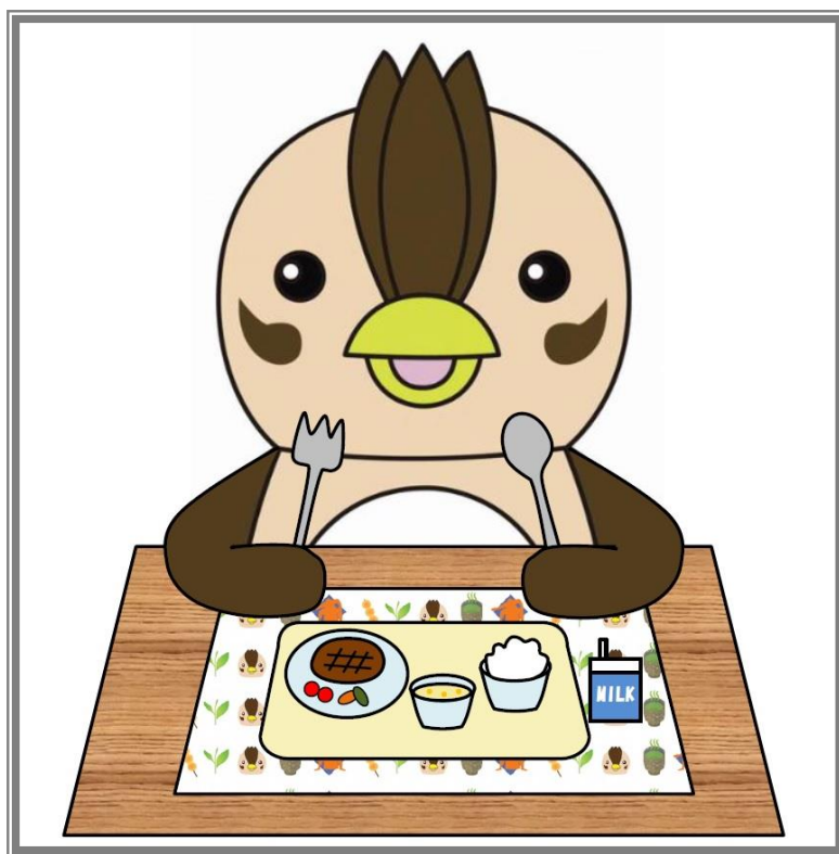
入間市マスコットキャラクター 「いるティー」

入間市こども支援部青少年課放課後子ども担当 〒358-8511入間市豊岡1-16-1 TEL 04-2964-1111(内線2362～2364)