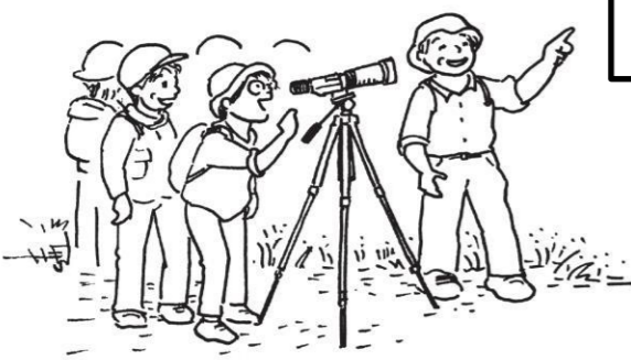
地図・イラスト作: 小川真澄 (自然かんさつ会参加者)