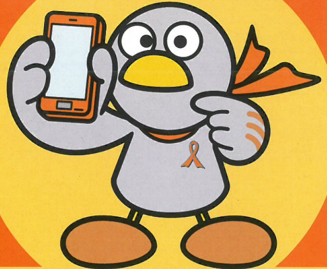
埼玉県マスコット コバトン