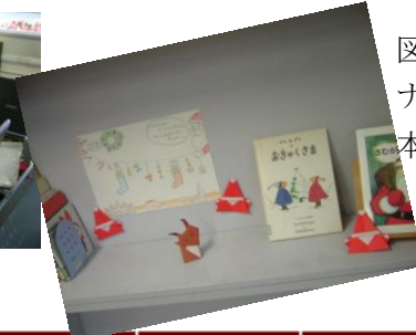
図書室の展示コーナー。クリスマスの本を展示しました。