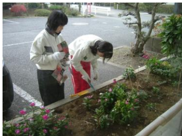
球根を植えました。 春に何が咲くか、 お楽しみに！

高倉公民館での3日間では、花壇の花植えや図書室の整理や展示、データ入力などにチャレンジしました。最初は緊張していた生徒も、次第に慣れていき、サークルさんにも元気にあいさつをしていました。3日間の経験を生かし、これからもがんばってもらいたいと思います。