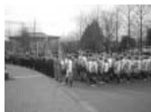
消防出初め式の様子

4月…入団式 5月…1日消防体験研修 6～9月…訓練・研修会 9月…視察研修（消防博物館） 10月…消防フェア参加 11月…消防団特別点検参加 12月…防火餅つき大会 1月…消防出初め式参加 1～3月…訓練・研修会