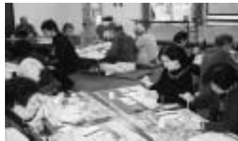
昨年の絵手紙入門