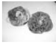
古布で作ったコサージュ