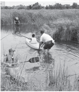
▼カヌーは楽しいぞ