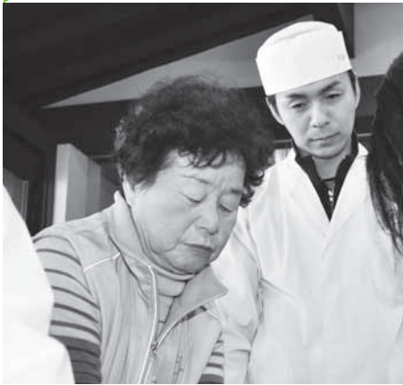
▲手元を見つめる真剣なまなざし