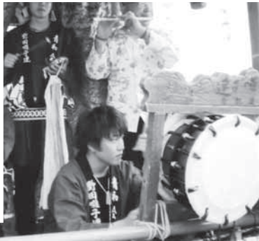
▼太鼓をたたきながら後輩の踊りを気遣う