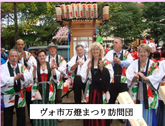
ヴォ市万燈まつり訪問団

新潟県佐渡市とは1986年（昭和61年）に、ドイツ・ヴォルフラーツハウゼン市とは1987年（昭和62年）に姉妹都市提携を行ない、また、中国・奉化市とは2000年（平成12年）に友好都市締結を行ないました。主な活動は、訪問団受入れ事業の企画、交流会の運営、ドイツ語・中国語の通訳などです。