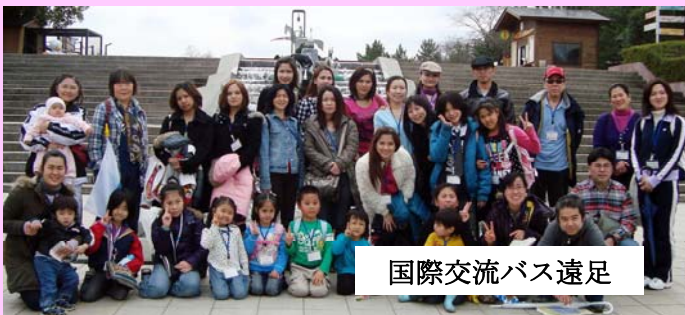
国際交流バス遠足