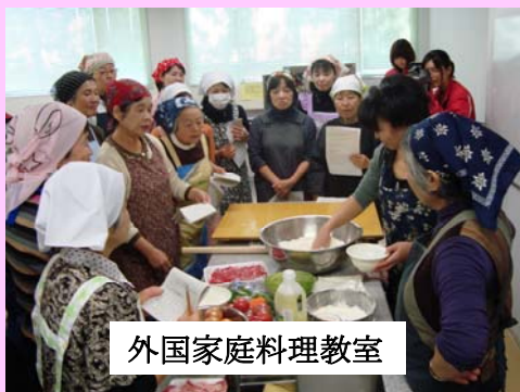
外国家庭料理教室

年3回実施している「台所から世界を知りましょう！」（外国家庭料理教室）・入間万燈まつり「世界のともだち広場」の企画・運営、国際交流バス遠足や文化紹介事業を実施し、国際理解に努めています。