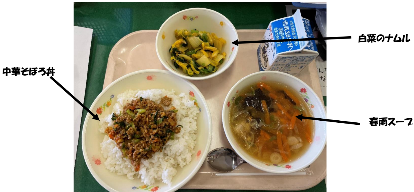
食後の一句 百歳を めざして白菜 食べ尽くす