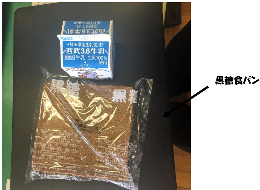
食後の一句 黒糖パン 口にすずしさ もってくる