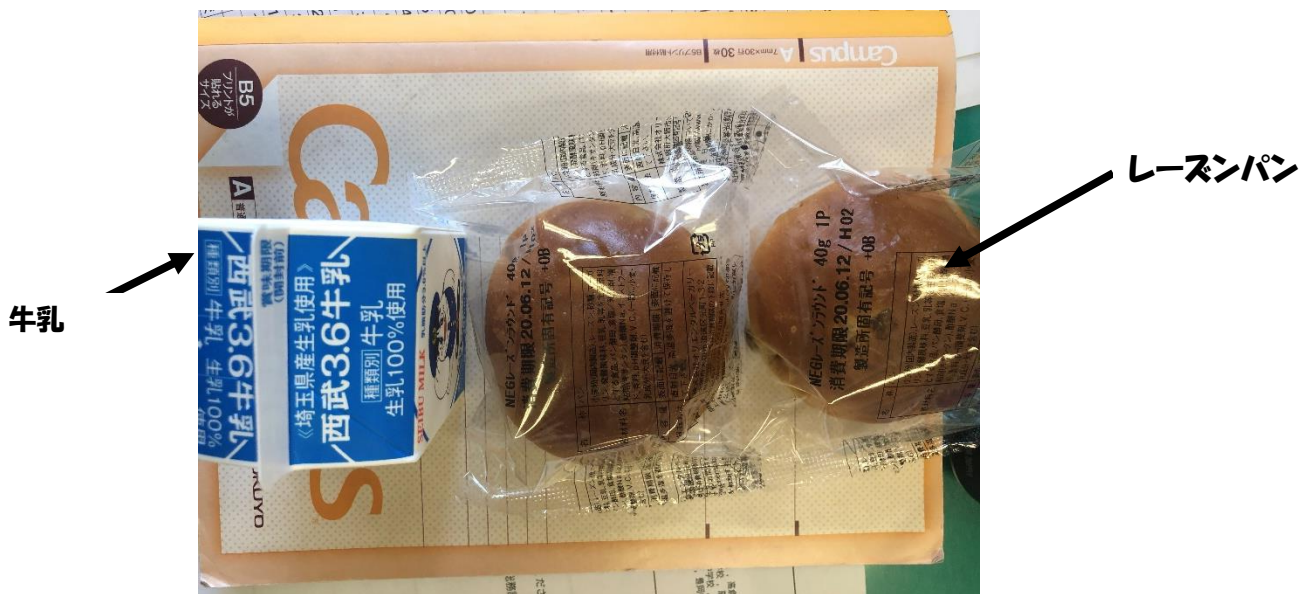
食後の一句 レーズンを 食べて暑さに