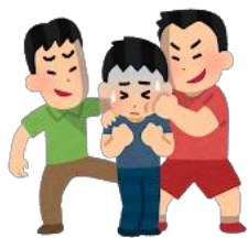
暴力・金品をたかられる