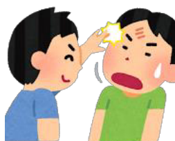
冷やかしやからかい