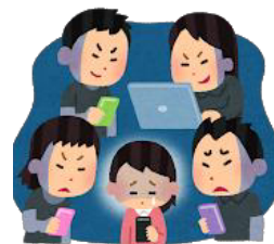
パソコンやスマホでの ひぼう・中傷