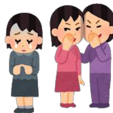
仲間はずれ・無視