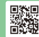
産業文化センター