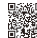
市民課窓口土曜開庁に関すること ※毎月第2・4土曜日に正午まで開庁