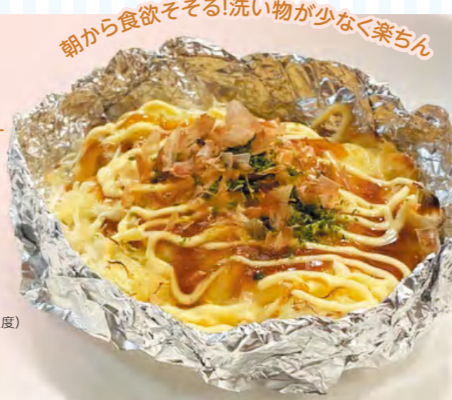
朝から食欲そそる!洗い物が少なく楽ちん

作り方 食材がくっつかないアルミホイルに、薄く切ったもちとキャベツをのせ、中央にくぼみを作り、卵をのせる。上にチーズをのせてトースター(200℃程度)で9分焼く。お好みでソース、マヨネーズ、青のり、かつお節をかけて完成!