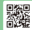
文化創造アトリエ・アミーゴ