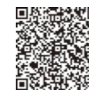
証明書コンビニ交付サービスに関すること