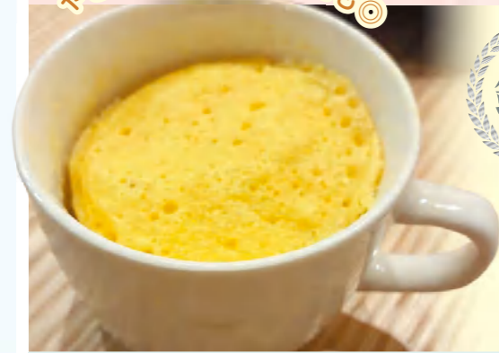
休日モーニングにもぴったり

作り方 にんじんをすりおろしてマグカップ等に入れ、砂糖、卵、油を入れて混ぜる。小麦粉とベーキングパウダーを入れてよく混ぜ、電子レンジ(600W)で3分加熱する。