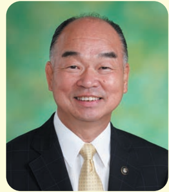
入間市長 田中 龍夫

なお、発刊にあたりまして、広告の掲載にご協力をいただきました企業・団体・商店主の皆様には深く感謝申し上げます。