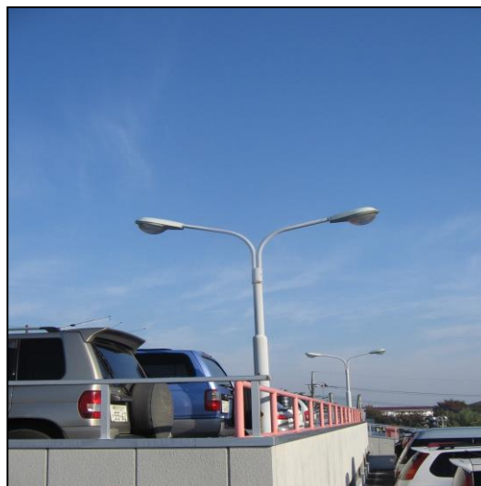
駐車場灯 各駐車場を管理している会社や個人が維持管理しています。