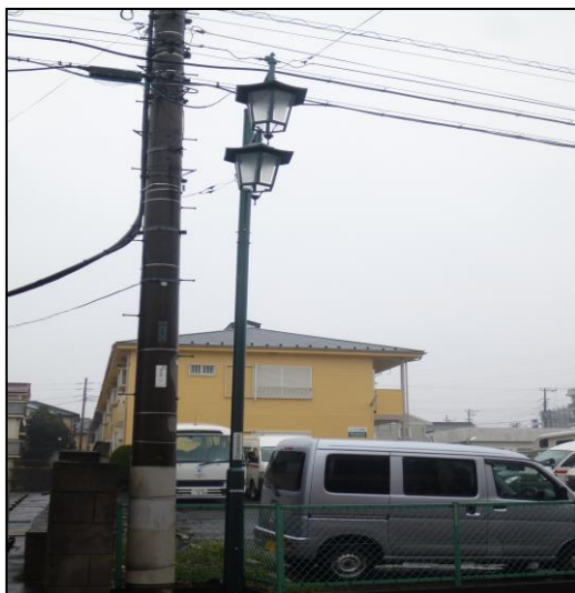
商店街の街路灯 各商店や各地区の街路灯維持会が維持管理しています。 （商工会☎2964-1212）