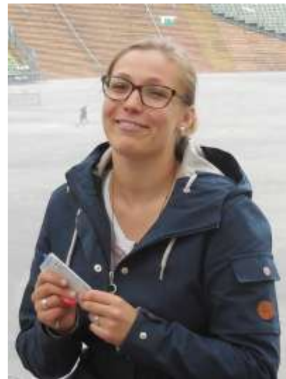
オリンピックスタジアムの 案内スタッフ