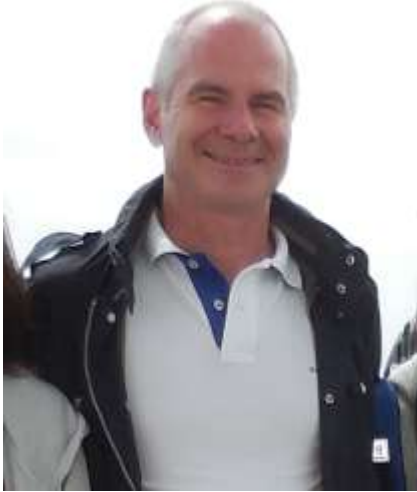
クラウス・ハイリングレヒナー第一市長