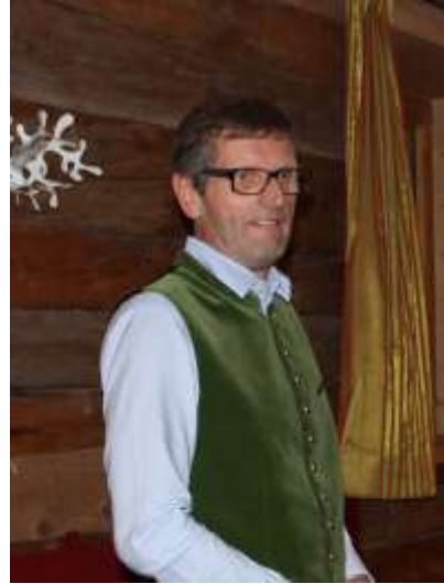
ヘルムート・ホルツオイ第三市長