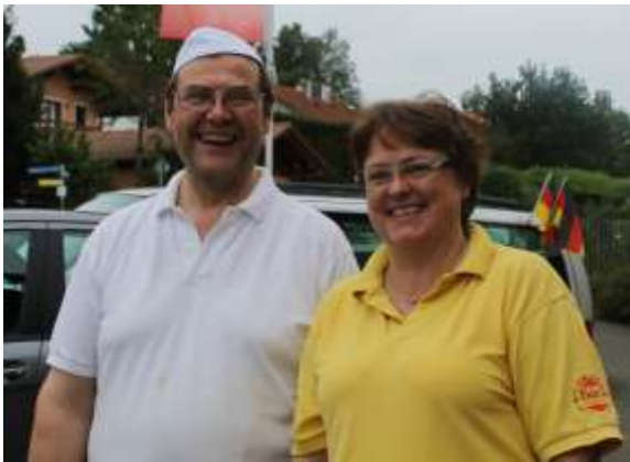
ケーニヒスドルファー・バックシュトゥーベ (プレッツェル体験)