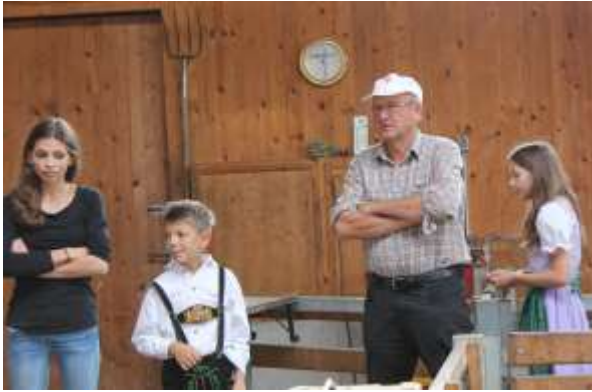
農場でお世話になった家族