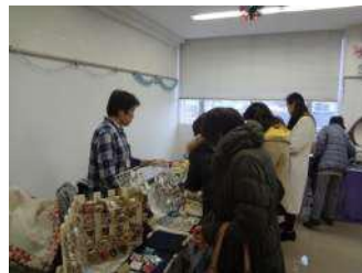
イルミッナの様子

ら、年配の方までたくさんのお客様にご来場いただき、会場内は大変にぎわっていました。 受講生のハンドメイドのかわいい小物やアフセサリーをはじめ、木工品、野菜、お菓子など多様な品物が並び、来場された方は、手作りの品を見てとても楽しんでいました。