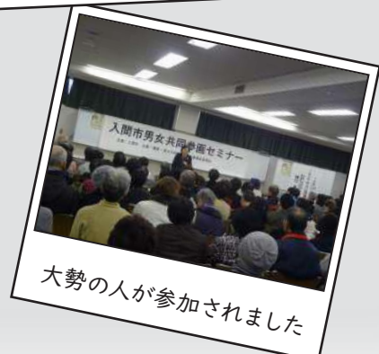
大勢の人が参加されました