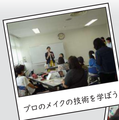
プロのメイクの技術を学ぼう

2時間たっぷり、満足できる内容でした。大変楽しい講座でした。日常生活に活かしていこうと思います。