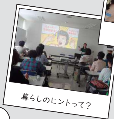
暮らしのヒントって？