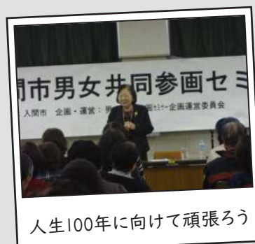
人生100年に向けて頑張ろう

何事にも目標を持ち一歩前に進むことの大切さ、自分自身が楽しめる人生にしたいと思いました。