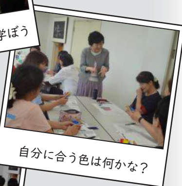
自分に合う色は何か？