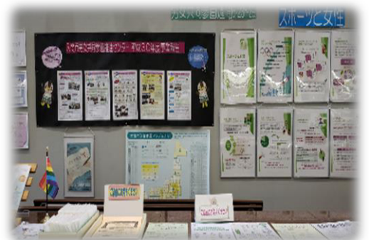
令和元年度 パネル展の様子

男女共同参画推進本部では、毎年6月23日から29日までの1週間「男女共同参画週間」を実施しています。これは、「男女共同参画社会基本法」の公布・施行日である平成11年6月23日をふまえたものです。