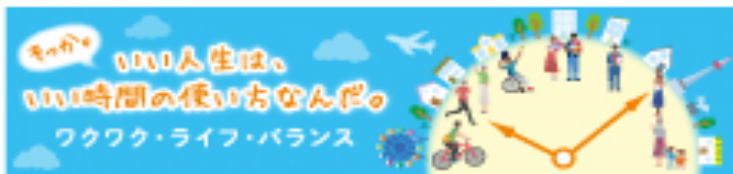
令和2年度男女共同参画週間バナー