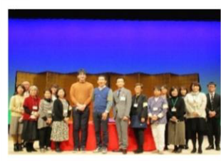
令和2年度男女共同参画セミナー 公開講演時の記念撮影の様子 (ボランティアスタッフ・講師・ 市職員)

男女共同参画推進センターでは、男女が個人としての能力を発揮し、共に輝いて生きるために、自ら学び考えるセミナーの開催や情報紙の発行をしています。このセミナーの開催や情報紙の発行の企画・運営に携わっていただけるボランティアスタッフを募集します。