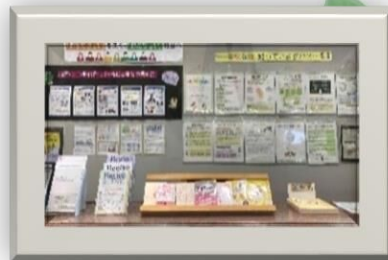
令和5年度 パネル展の様子