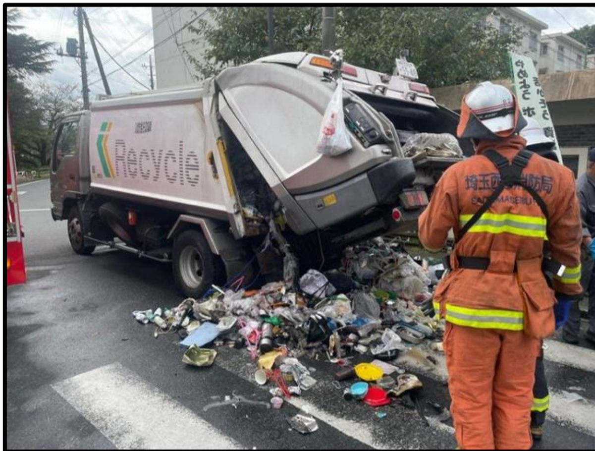
令和4年10月18日、スプレー缶、カセットボンベ(卓上ガスコンロ用)、使い捨てライター等のガスライターが不燃ごみに混在していたことが原因で発生した車両火災(写真上)

下の写真のようにスプレー缶、カセットボンベ(卓上ガスコンロ用)、使い捨てライター等のガスライターを 他の不燃ごみと同じ袋に入れ ないでください。 他の不燃ごみとは別の無色透明の袋に入れて 出してください。