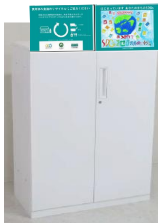
回収ボックスイメージ