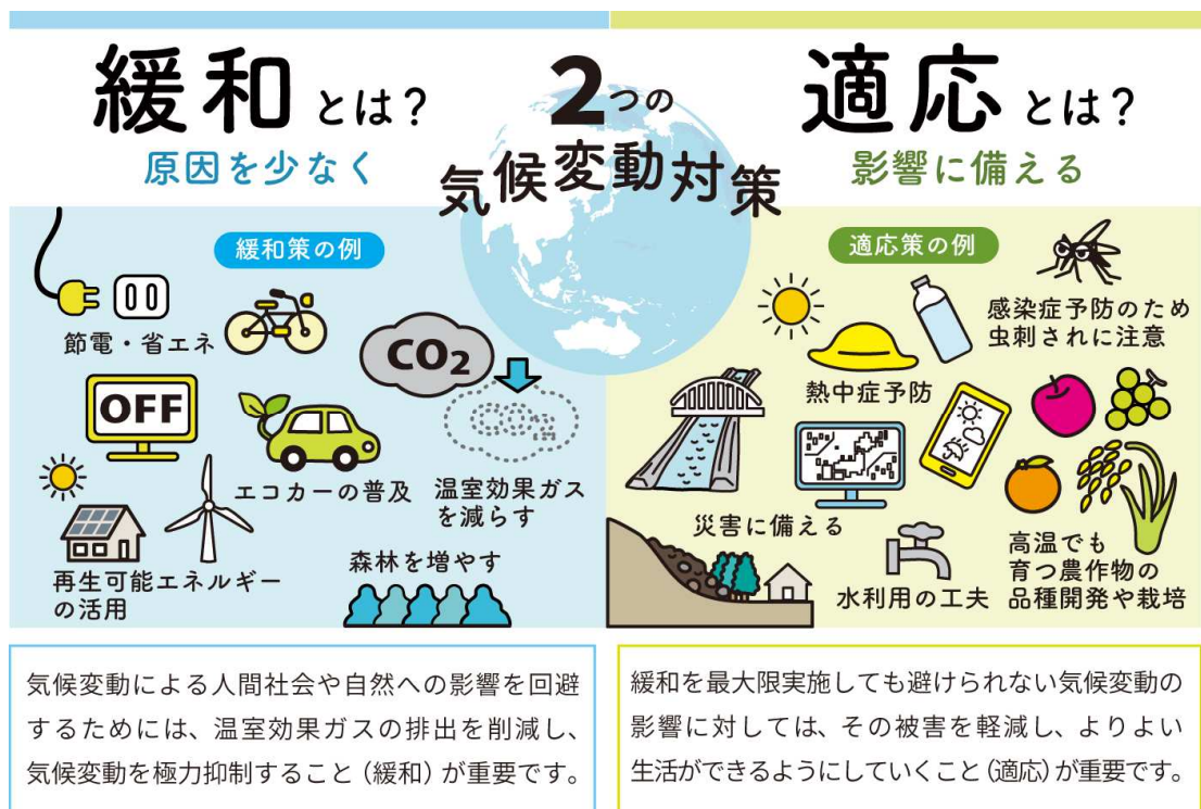
図 1.1-2 2つの気候変動対策

気候変動をはじめとした様々な課題に対する負担意識を持つのではなく、課題の解決に向け、多くの人々がその課題の本質に目を向けることで、変革が起こりえます。このような現状を踏まえ、本市においても、気候変動に対する本質的な取組が求められています。市民や事業者が気候変動対策に関心を持ち、本市とともに、温室効果ガスを排出しないエネルギーシステムへの転換などに取り組む必要があります。また、気候変動による様々な影響に備え、災害のリスク回避・軽減を図る適応策に、これまで以上に注力して取り組む必要もあります。