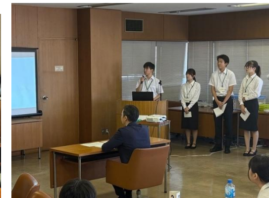
令和7年度インターンシップの様子