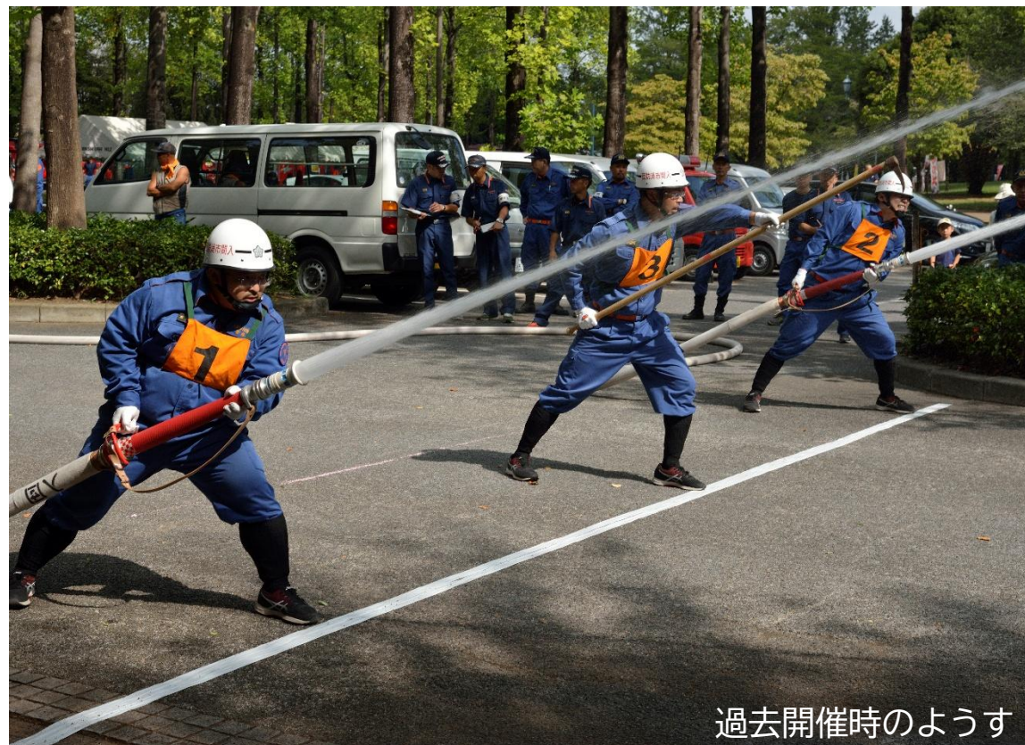
過去開催時のようす

火災対応のための「消防ポンプ自動車」、運び出して放水できる「可搬ポンプ」、それぞれのポンプ操作の技術を競う競技会です。