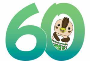
入間市市制施行60周年