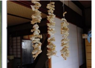
乾燥中のユズマキ