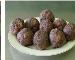
イノコのポタモチ