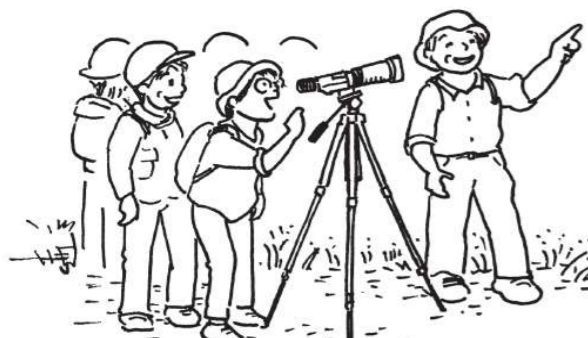
地図・イラスト作:小川真澄(自然かんさつ会参加者)