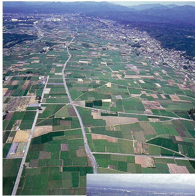
入間川と加治丘陵