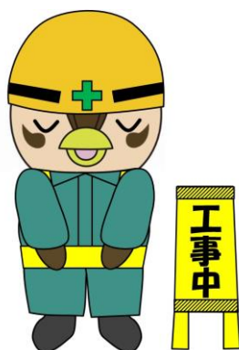
入間市マスコットキャラクター 「いるティー」

市では、地震発生時におけるブロック塀等の倒壊による被害を防止するため、倒壊の危険性があるブロック塀等の撤去工事を行う方に、撤去工事費用の一部を補助します。