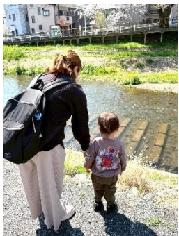
水がキラキラきれいだね

あいくる近くの霞川は川沿いに桜並木が続いています。天気の良い日に広場に来てくれた親子さん達と一緒に、さくらさんぽにでかけました。満開の桜にみんな大喜び。こども達は指先で春を確かめるように、枝に手を伸ばしていました。