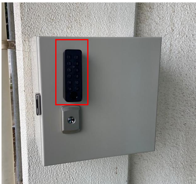
パスコードのお知らせ（例）