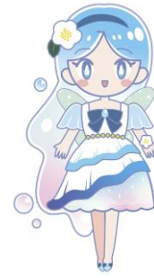
“上下水道事業マスコット