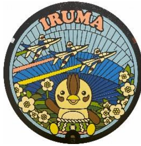
“いるティーデザインマンホール”