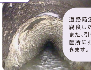
腐食した下水道管 (市内 平成3年度埋設)

道路陥没等の事故を防止するため、腐食した管の改築工事を進めます。また、引き続き、点検調査および異常箇所における改築工事を実施していきます。