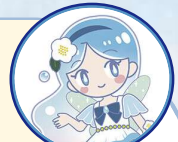
上下水道事業キャラクター いるみ

はじめに、上下水道事業をどのように運営しているかご説明します。上下水道事業は、公営企業法に基づき、次のイラストのように水道料金・下水道使用料を資金とし、運営しています。