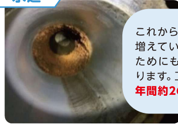
更新時期を迎え撤去した水道管 (市内 昭和41年度埋設)

これから、更新時期を迎える水道管が増えていきます。漏水等を起こさないためにも更新工事を進める必要があります。工事費用は、令和9年度以降、 年間約26億円 を見込んでいます。