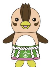
入間市マスコットキャラクター いるティー