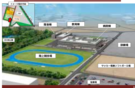
旧東町側留保地跡地の運動施設・自衛隊病院等の完成予想図