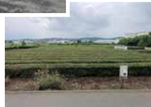
北中野グラウンド・宮寺新グラウンド予定地