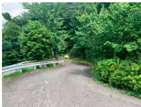
旧グリーンロッジまでの急な坂道

質問 新型コロナウイルス感染拡大防止対策について①登校基準②保護者へわかりやすい案内を③学校・市のHPへ掲載を④入間市独自で基準の統一を。