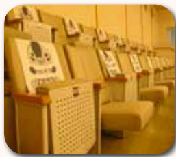
間隔を空けた傍聴席