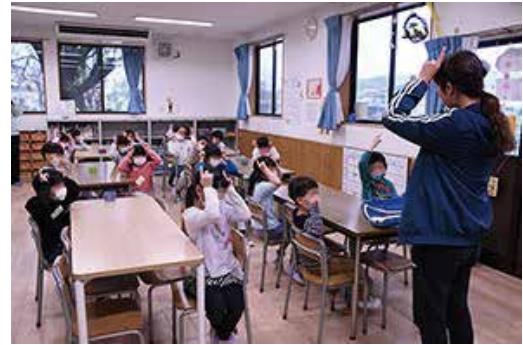
学童保育室の様子