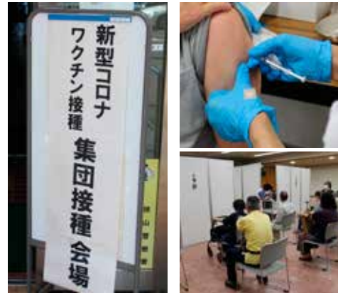
新型コロナウイルスワクチン集団接種の様子

【その他】新久の都市計画道路予定地付近への工業団地の拡張、多摩都市モノレールの箱根ヶ崎駅への延伸、リニア中央新幹線（仮称）神奈川県駅の新設による八高線沿線のまちづくりへの影響、上藤沢・林・宮寺間新設道路の延伸について。