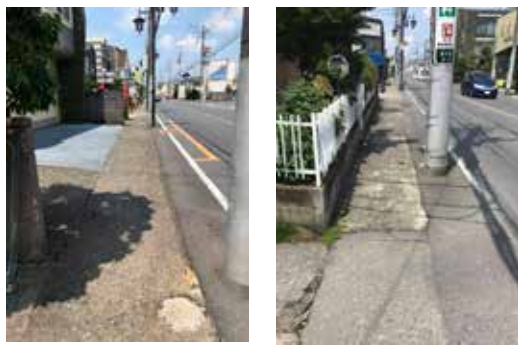
市道幹8号線(町屋通り)未整備区間520mの歩道の現状