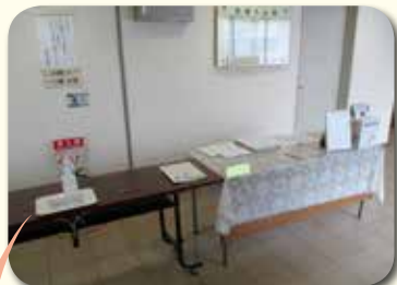
エレベーターを降りると、正面に傍聴受付があります。