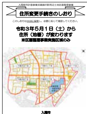
武蔵藤沢駅周辺土地区画整理事業で配布した「住所変更手続きのしおり」

教育長 教育委員会と担当指導主事が活用、操作方法をサポート。全ての学校・学級でICT活用を実現することが課題。各家庭の支援を充実し学びの質の向上に努める。