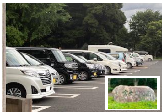
富士見公園駐車場の様子

【その他】①新型コロナウイルス感染症が疑われる方の移動に民間事業者と協力して専用のタクシーを。②運転免許証自主返納時のコミュニティバス回数券の無料交付をタクシー券に切り替えを。