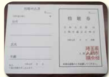
傍聴申込票に必要事項を記入し、傍聴券と傍聴資料を受け取ってください。