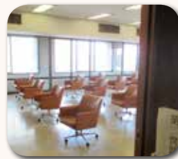
第二傍聴席（16席）の設置