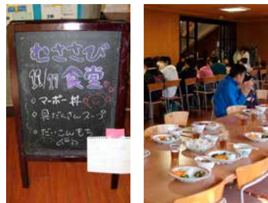
青少年活動センターのむさびび食堂の様子