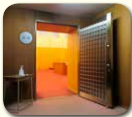
扉を開放し常時換気