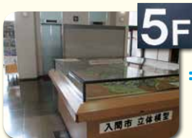
市役所に入り、西口エレベーターで5階まで上がります。

議会で行われる本会議や委員会は、どなたでも傍聴することができます。 市議会活動や市の施政方針などを実際に見聞きすることができます。 また、感染症の拡大を防止するため、傍聴される際は、次のことにご配慮をお願いいたします。 ・発熱など風邪の症状がある方や体調がすぐれない方は、傍聴をご遠慮ください。 ・マスクの着用について、ご協力をお願いします。 ・当日受付において検温・手指の消毒に、ご協力をお願いします。 皆様のご理解、ご協力をいただきますようお願い申し上げます。