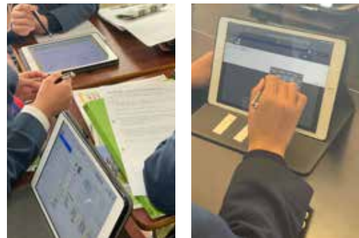
いよいよ始まるG I G Aスクール構想