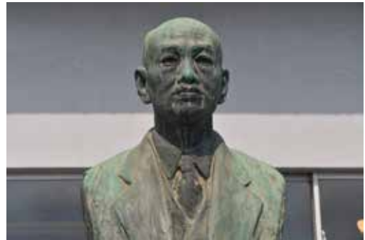
西三ツ木の、旧金子村役場跡地のJA金子支店に位置する、市村高彦氏の胸像。

市長 (2)市民への広報で、市村氏の認知度を高めてゆきたい。制作者は東洋のロダンと呼ばれる文化勲章受章者の朝倉文夫氏で、全国に誇れ、シティセールスに活用したい。作品が目的の来訪者を、金子地区や茶畑の周遊など、観光にも繋げてゆきたい。