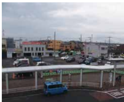
武蔵藤沢駅から見た区画整理事業地内

市長 この貸付制度は地下鉄大江戸線の早期延伸を目的とした地域住民への支援策。市内の各土地区画整理事業との公平性の観点から類似した制度の導入は考えていない。