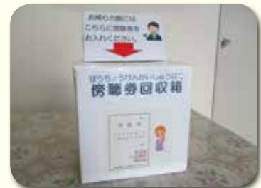
お帰りの際は、傍聴券を受付に返却してください。