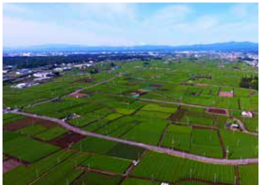
入間市の代表的景観のひとつ狭山茶主生産地から圏央道青梅IC、富士山を望む

環境経済部長 1. 農地 839ha 農家 880 戸。魅力1位は自園製造販売の狭山茶と茶畑景観。露地野菜、養豚直売が特徴。2. 農地中間管理事業、実質化された人・農地プラン、スマート農業の加速支援、入間市IoT 共創コンソーシアム推進等、SDGs で次世代につなぐ。