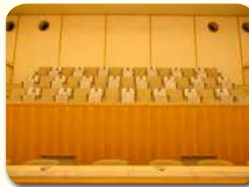
傍聴席は33席（車いす用傍聴席3席を含む）あります。