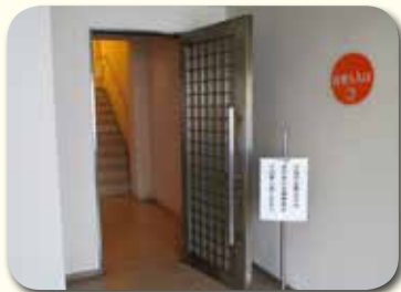
受付の左右にある傍聴者入口より入場してください。