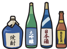
町会の集会や 旅行等の催し物への 寸志や飲食物の 差し入れ