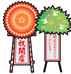
落成式・ 開店祝いの花輪