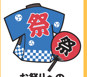
お祭りへの 寄附や差し入れ