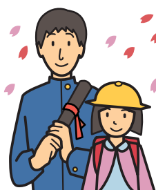
入学祝い・卒業祝い