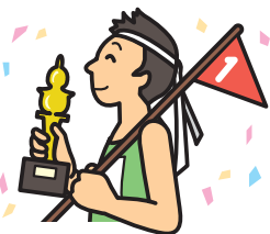
運動会や スポーツ大会への 飲食物の差し入れ