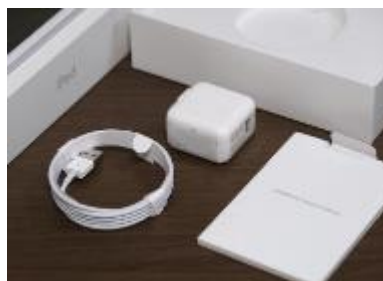
ACアダプタ・充電コード