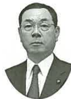
入間市教育委員会教育長 村野 志朗