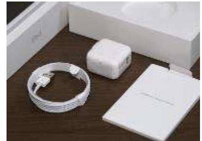
ACアダプタ・充電コード