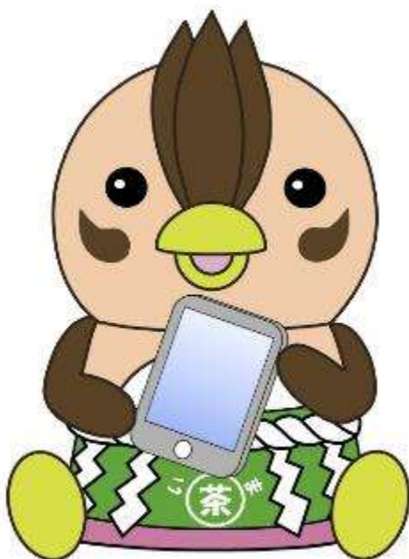
入間市マスコットキャラクター 「いるティー」