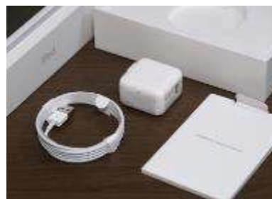
ACアダプタ・充電コード