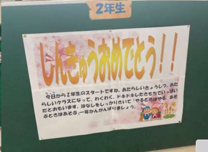
一つ一つの言葉に、先生たちの思いがたくさん詰まっています。