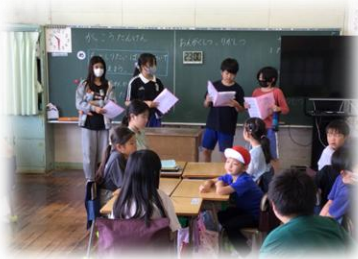
縦割り活動始まりました