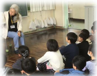
学校応援団さんによる 読み聞かせ

さわやかな気候の中、子供たちは様々な場面でがんばっています。本年度から「ふじっこまつり」が6月となりました。縦割り班の顔合わせを行い、6年生を中心に企画、準備が始まっています。どんなお祭りになるのか今から楽しみです。