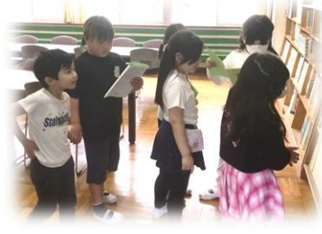
1・2年生学校たんけん