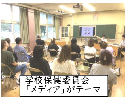
学校保健委員会 「メディア」がテーマ