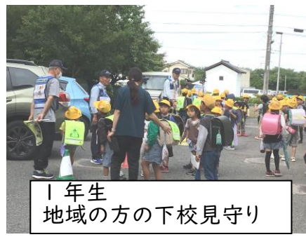
1年生 地域の方の下校見守り