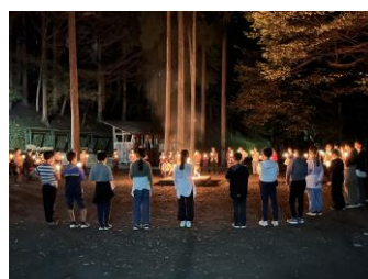
【5年宿泊学習・名栗】