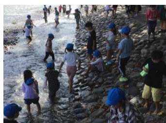
【2年遠足・飯能河原】