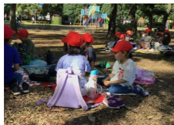
【1年遠足・富士見公園】

10月はたくさんの行事が行われました。それぞれの行事で子供たちは活躍し、成長しています。