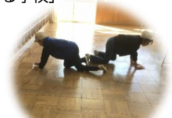
4月3日の準備登校の様子(新6年)