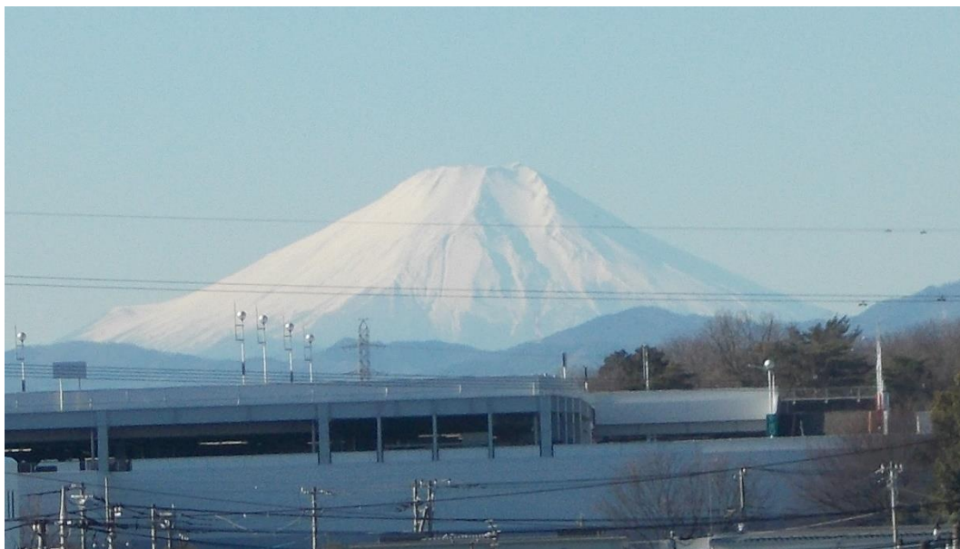
令和8年1月8日 藤沢中学校から望む富士山

あけましておめでとうございます。本年、令和8年もどうぞよろしくお願いいたします。漢字の「八」は末広がりという意味する縁起の良い数字とされ、下に向かって広がる様子から発展や繁栄が永久に続くことを表しています。また数字の「8」を横に寝かせると「∞」、これはインフィニティという記号になり、“無限”という意味で、終わりがなく、限界が存在しない状態を表しています。今年、令和8年、すばらしい年になるようにお互いに、まずは基本を大切に、何事も面倒くさがることなく、立てた目標に向かって挑戦していきましょう。