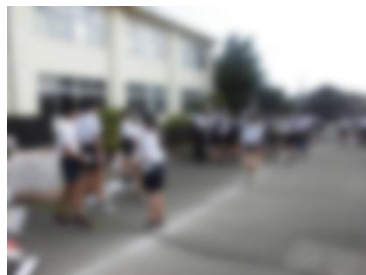
昨年度の資源回収の様子

最後に、各委員会の活動が紹介されました。すでに、各委員会のメンバーが決まり、活動が始まっています。よりよい学校にしていくために、主体的に活動して行ってほしいと願っています。