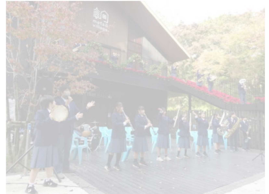
▲吹奏楽部 メッツア・クリスマスコンサート

生徒の皆さんは、学校行事を通して磨きを掛けた仲間と心をひとつにする姿勢を大切にしながら、2学期締めくくりのひと月を充実したものにしてください。